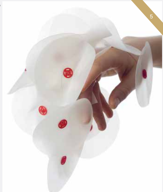
Camilla Prasch, Mega , bague/ring, 2009