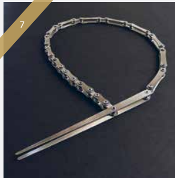
Blanche Tilden, Speed , collier/ necklace, 2000