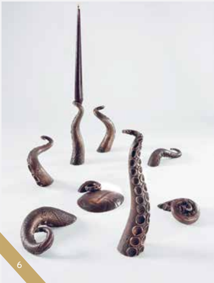
David Bielander, Octopus (Krake) , candélabre en bronze coulée, édition limitée à 25 ex./ candelabra in bronze cast, limited edition of 25, 2012